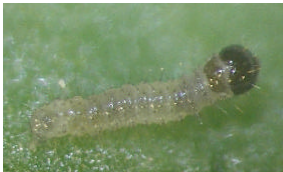
オオタバコガ孵化直後