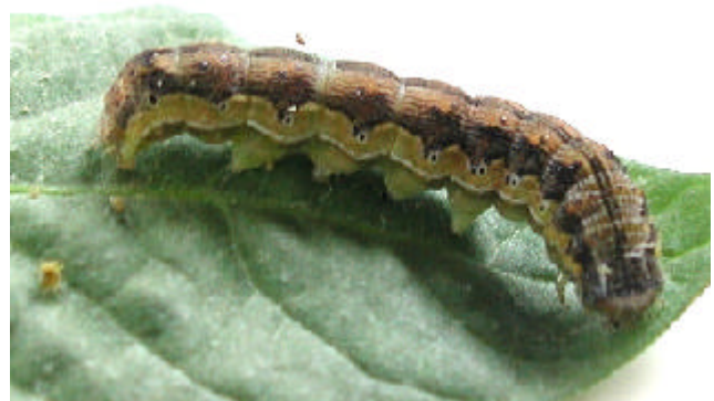
オオタバコガ老齡幼虫