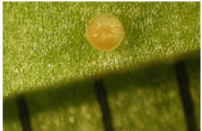
オオタバコガの卵（目盛りは1mm）