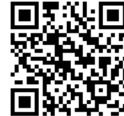
最新の病虫害發生状況