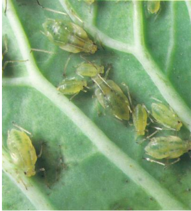
写真 キャベツに寄生したアブラムシ類

○病害虫防除所の発行する情報の入手は、インターネットをご利用ください 「福岡県病害虫防除所ホームページ」 http://www.jppn.ne.jp/fukuoka/