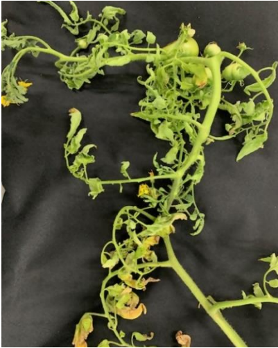
図1 上位葉の黄化および萎縮