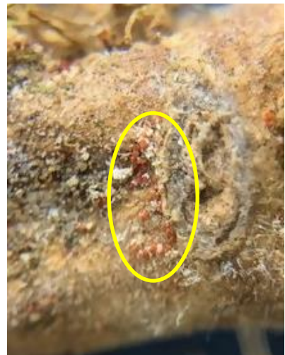
図3 地際部表面の子のう殻