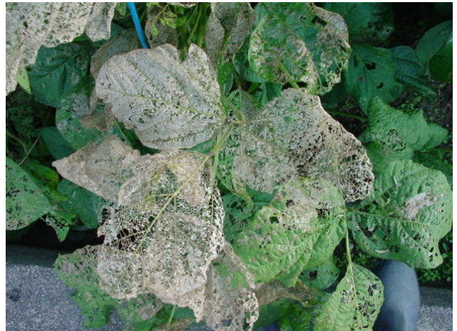
写真2 若齢幼虫によるダイズでの白変葉