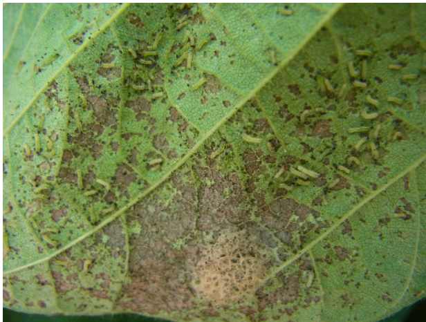
写真1 ハスモンヨトウ卵塊と若齢幼虫