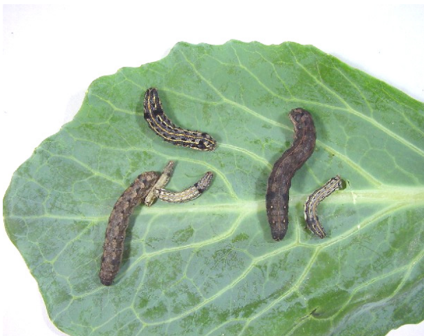
写真3 ハスモンヨトウ中老齢幼虫