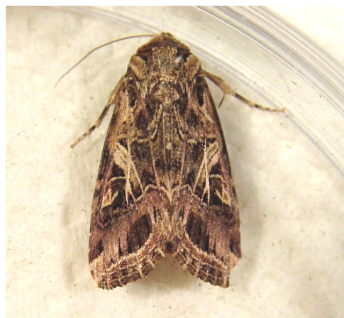
写真4 ハスモンヨトウ成虫

病害虫防除所インターネットホームページ URL: http://www.jppn.ne.jp/kagawa/