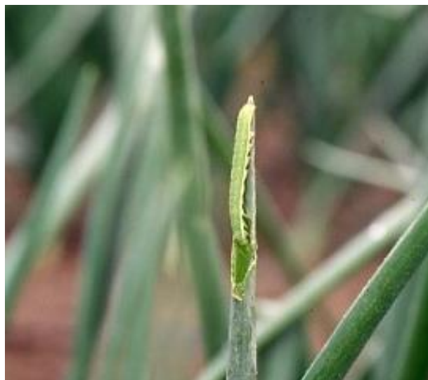
写真1 シロイチモジヨトウの幼虫