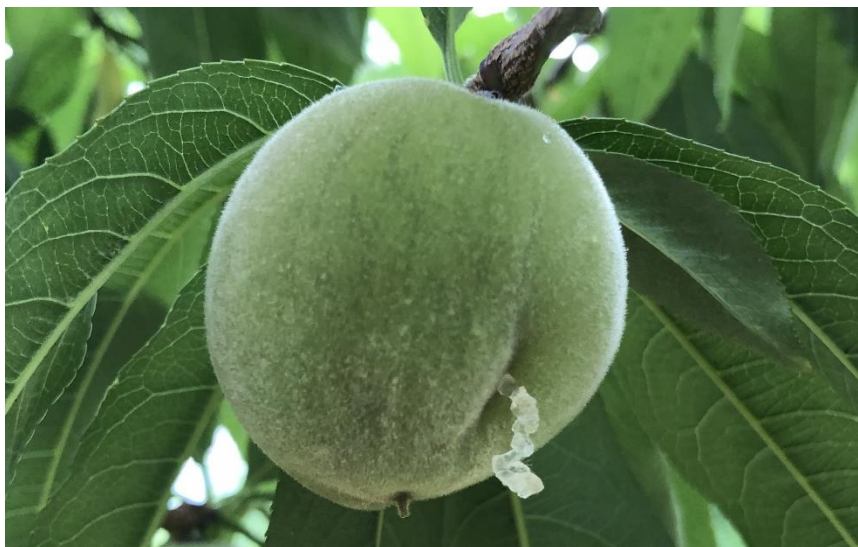
第3図 吸汁部位からヤニが漏出したモモ果実