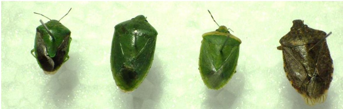
第1図 果樹を加害する主要4種類のカメムシ類 (左からチャバネアオカメムシ、ツヤアオカメムシ、アオクサカメムシ、クサギカメムシ)