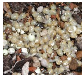
←ふ化したばかりのアフリカマイマイの稚貝