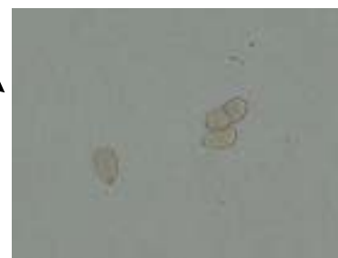
葉かび病菌の分生子 (単胞もしくは2胞の紡錘形)