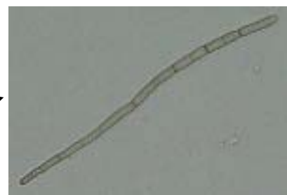
すすかび病菌の分生子 (0~15個の隔壁を有する鞭状)