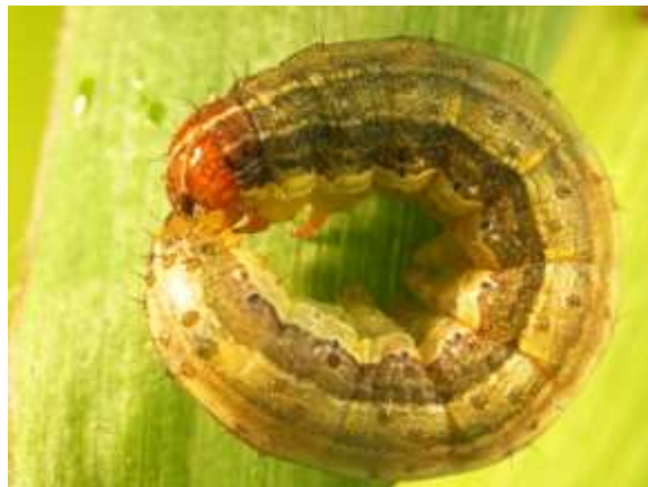
図4 ツマジロクサヨトウ幼虫

熊本県病虫害防除所 (熊本県農業研究センター 生産環境研究所 予察指導室) 担当：中村、岡島 TEL 096-248-6490 FAX 096-248-6493