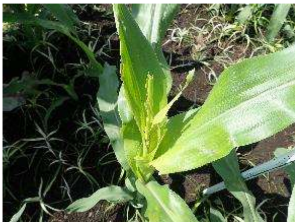
図3 飼料用トウモロコシの被害株