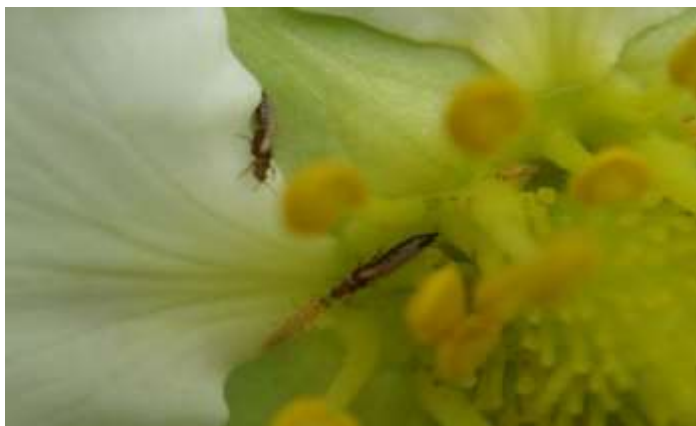
写真1 イチゴ花に寄生するアザミウマ類 (体長1~2mm程度)