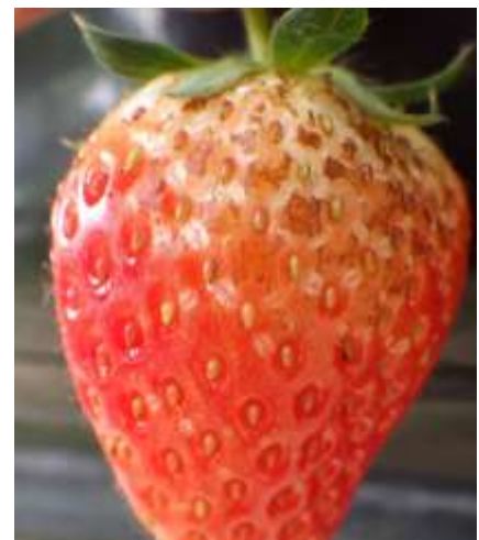
写真2 アザミウマ類による果実表面の被害

熊本県病害虫防除所 (農業研究センター生産環境研究所 予察指導室) 担当：中村、中井 TEL：096-248-6490