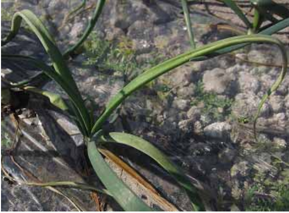
図3 罹病株（草丈が低く、葉がやや黄化して外に湾曲）