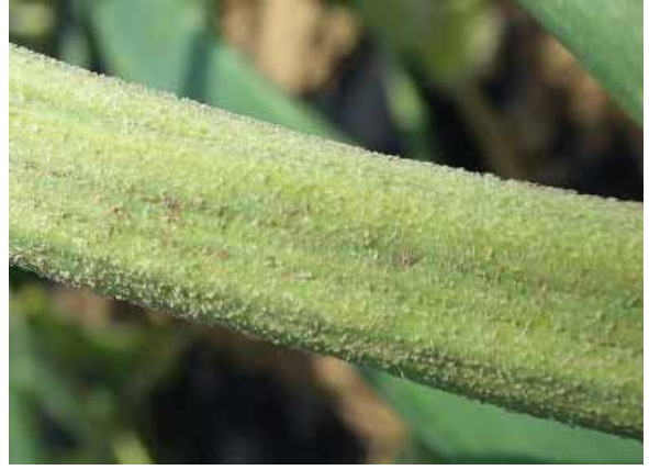
図4 発病状況（表面に暗紫色のかびを生じる）