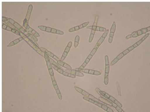
写真5 病斑部に形成された分生子