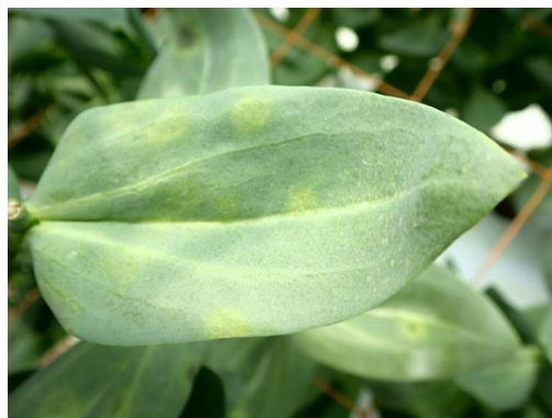
写真4 発生初期の退緑斑