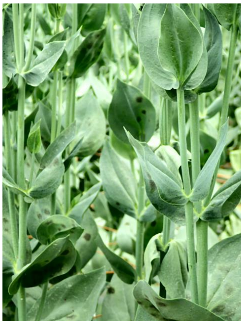
写真1 圃場での発生の様子