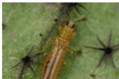
ミナミキイロアザミウマ成虫※