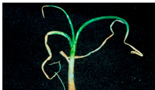
べと病（苗における発病状況）＊