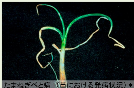
たまねぎべと病（苗における発病状況）*