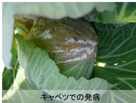
キャベツでの発病