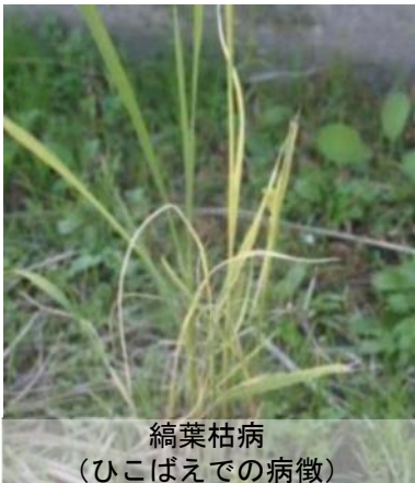
縞葉枯病 (ひこばえでの病徴)