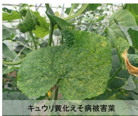
キュウリ黄化えそ病被害葉