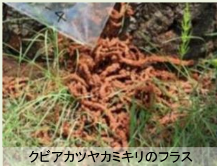
クビアカツヤカミキリのフラス