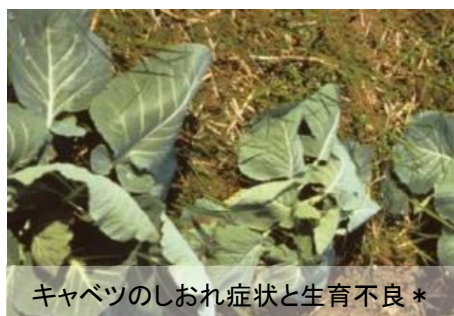
キャベツのしおれ症状と生育不良*