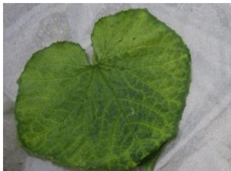
キュウリ退緑黄化病被害葉※