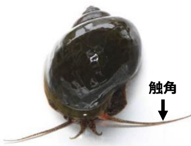
ジャンボタニシ (スクミリンゴガイ)