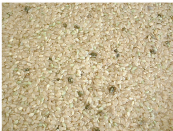
写真3 玄米に混入した稻こうじ病粒