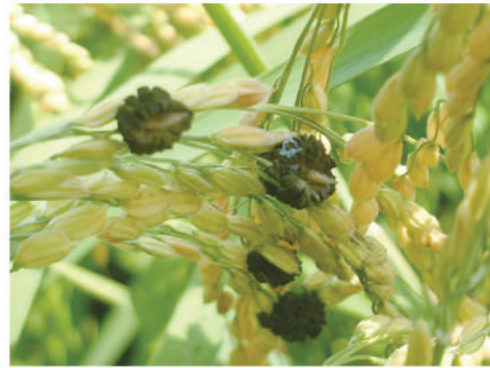
写真2 暗緑色の病粒（偽菌核）