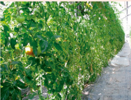
2a. 地上部の黄化症状