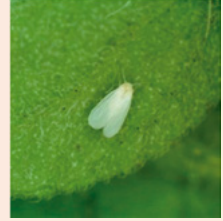
1f. オンシツコナジラミ (ToCVを媒介)