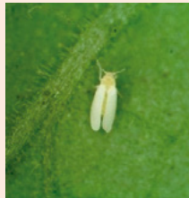
1e. タバココナジラミ (TYLCVを媒介)