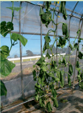
30a. 地上部の萎凋 (青枯症状)