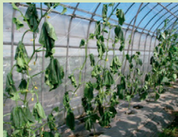
30b. 連続的(畝伝い)に 発生したほ場