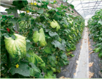
29a. 黄化が進んだ発病株 ほ場全体に発生