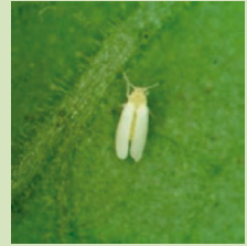
29c. タバコナジラミ (CCYVを媒介)