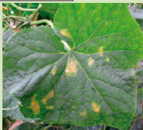
32a. 葉脈で囲まれた多角形の病斑