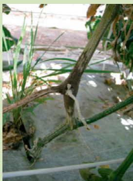
34b. 発病した茎 病斑部より上位は萎凋枯死する