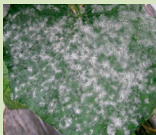
33b. 全面が白色のかびでおおわれる