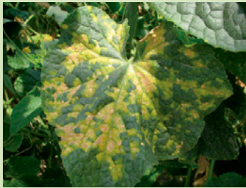
32b. 病勢が進展すると葉全体に広がって枯れ上がる