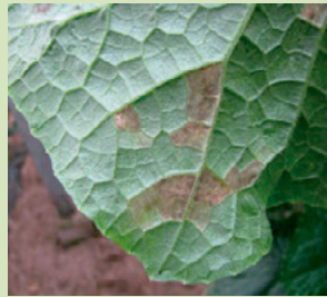
32c. 高湿度条件で葉裏に灰色の菌叢を生じる