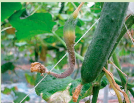
34a. 発病果実 果実表面に灰色の胞子が密生する