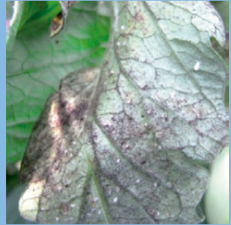
5c. 甘露による葉のすす病