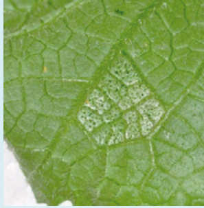
20b. キュウリ葉の被害