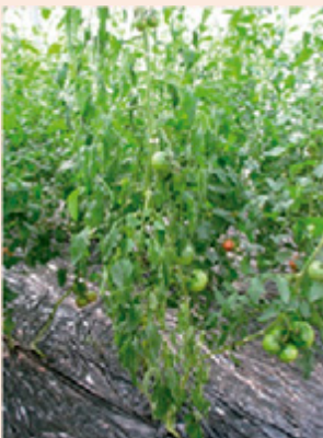
7a. 地上部の萎凋 (青枯症状)