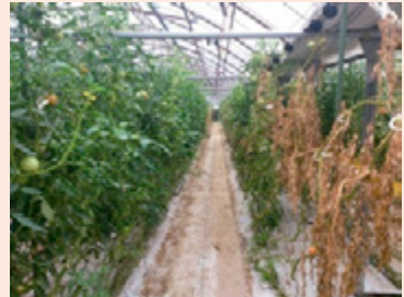
6f. 連続的(畝伝い)に発生したほ場