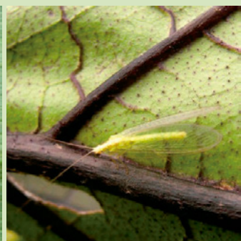
10f. ヤマトクサカゲロウ成虫

※クサカゲロウ類はアブラムシ類のほか、ハダニ類、アザミウマ類、チョウ目の卵なども捕食する