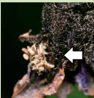
10d. 塵でカモフラージュした カオマダラクサカゲロウ 幼虫