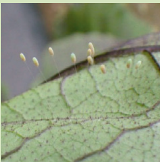
10b. ヨツボシクサカゲロウ卵