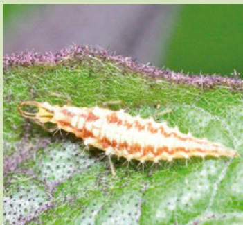
10c. ヤマトクサカゲロウ幼虫