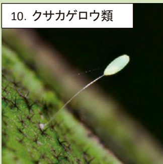
10a. ヤマトクサカゲロウ卵