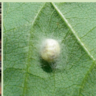
10e. ヤマトクサカゲロウ繭