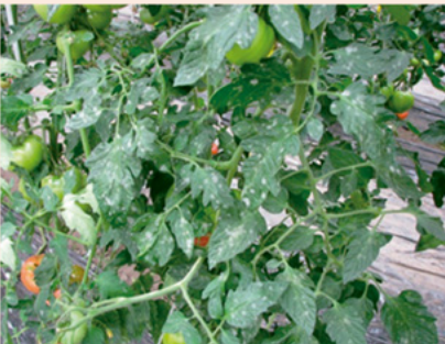
10a. 全体に発生した株