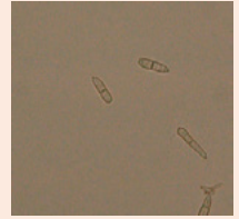
8c. 葉かび病菌 の分生子