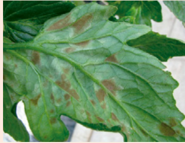
8b. 葉裏の症状 灰黄色から緑褐色のピロ ード状のかびが密生する