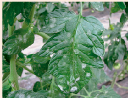
10b. 葉表に白い粉状のかび が生じる