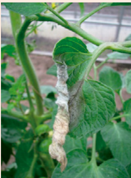
12a. 発病葉 灰緑色水浸状の病斑 を生じ、拡大して暗褐色になる