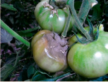
11a. 発病果実 暗褐色水浸状の病斑 を生じ、軟化腐敗する