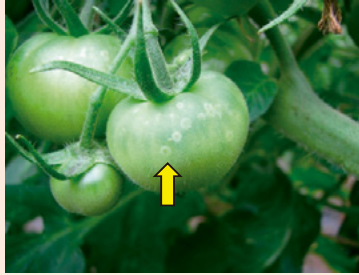
11b. 黄白色円形の小斑点 (ゴーストスポット)