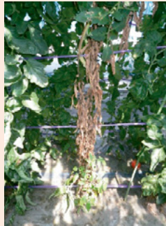
11e. 茎での発病により地上部が枯死した株 (右は拡大)