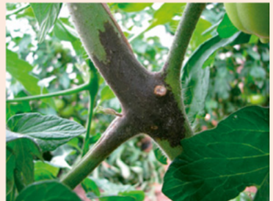
12c. 茎での症状 暗褐色水浸状の病斑を 生じ、後にややくぼんで 暗黒褐色になる