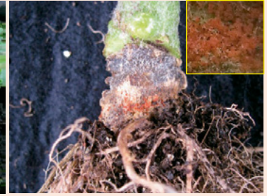
18a. 地際部の褐変 病徴部に子のう殻を 形成する(右上)