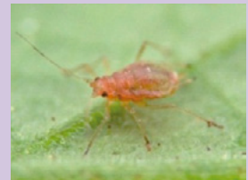
20c. モモアカアブラムシ (CMV、BBWWを媒介)