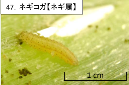
47a. ネギを内側から食害する幼虫