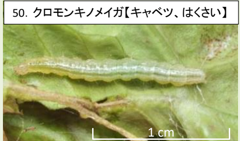
50a. レタスを食害する幼虫