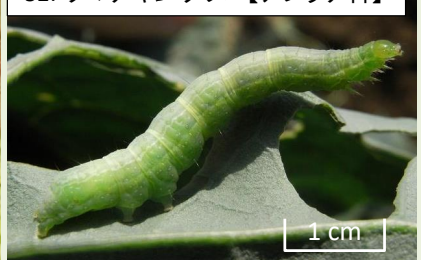
52a. キャベツを食害する幼虫