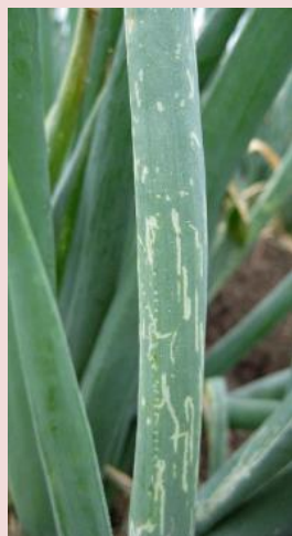
56c. 従来系統による ネギ葉の被害