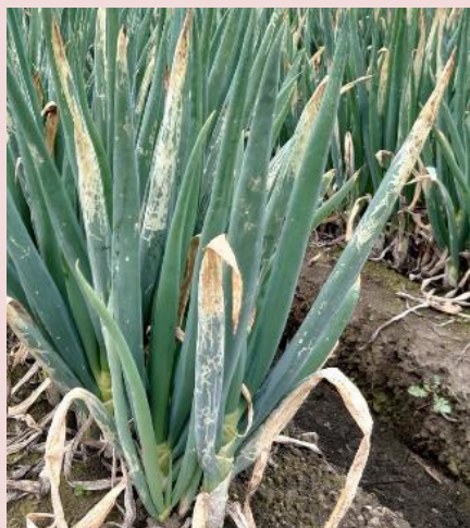
56d. B系統によるネギ葉の被害 (複数頭が集団で暴食する)