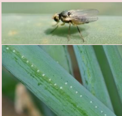
56b. 成虫(上)と成虫の食害痕(下)