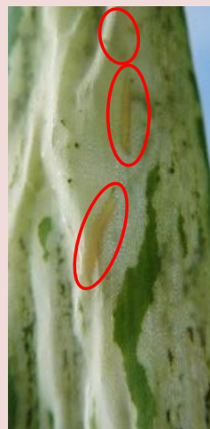
56e. B系統被害葉 (複数の幼虫が寄生)