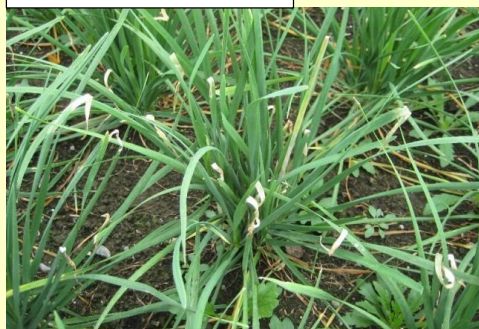
7a. 株全体 葉先が萎れる 灰色～灰暗色の病斑