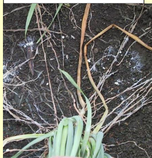
6a. 根部 白色の菌糸