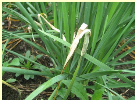
7b. 水浸状の退緑色病斑から軟化