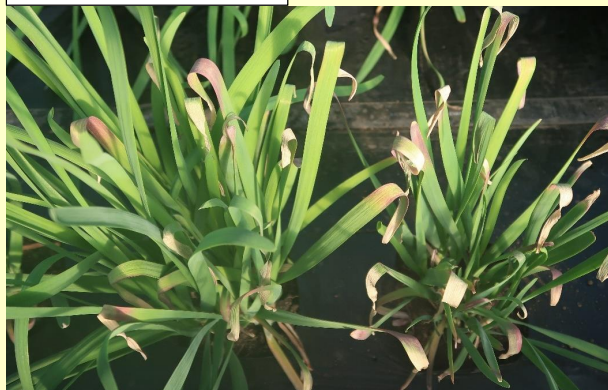
5a. 株全体 萎縮、葉先が巻くような枯れ