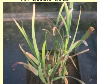
5c. 萎凋株 葉幅が細い