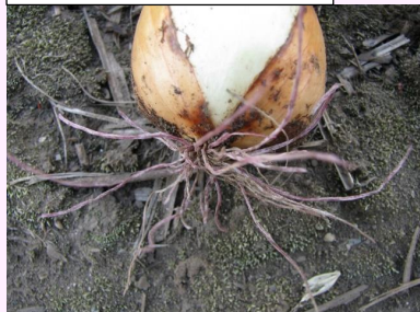
24a. 紅変・腐敗した根