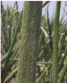
22b. 楕円形から長卵形の病斑(大型)