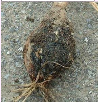
25a. 黒色小菌核の密生