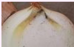
26b. リン片が水浸状に腐敗