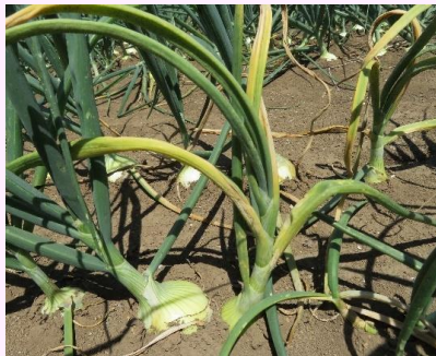
22c. 黄化・湾曲した被害株