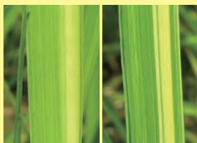
6-2 葉身の病徴(左) 生理的症状(右)