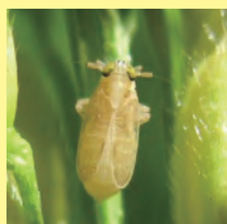
6-6 成虫 (短翅型雌)