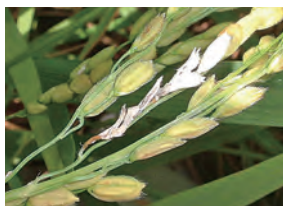
1-2 穂いもち (枝梗いもち)