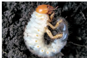
36-3 コガネムシ類幼虫