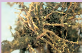
37-2 シストの着生した根