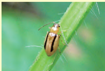
35-2 フタスジヒメハムシ成虫