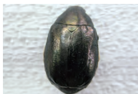
36-6 ドウガネブイブイ