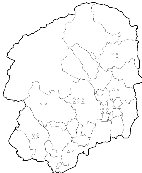
なし黒星病発生葉率(2011年6月)