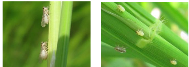
写真 左 ヒメトビウンカ雌成虫 右 ヒメトビウンカ幼虫

注：検定サンプルは5月15～24日に、麦類ほ場から採集したヒメトビウンカ第一世代幼虫