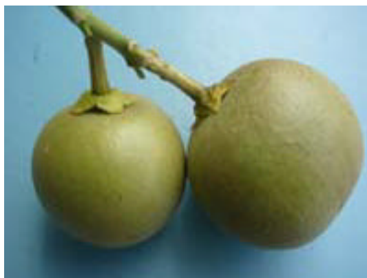
第 1 図 レモン幼果被害状況 .