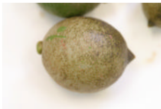
第 2 図 レモン幼果被害状況 (激甚) .