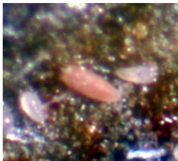
第 5 図 若虫と成虫 (拡大) .