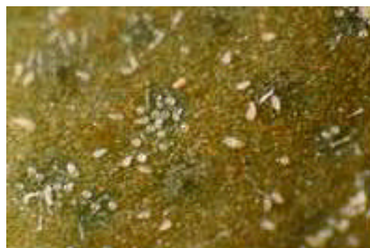
第 4 図 果実表面への寄生状況 (拡大) .