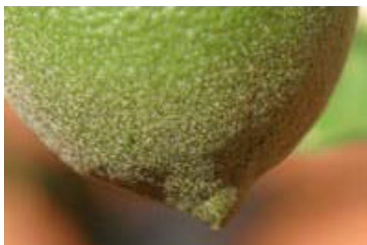
第 3 図 果実表面への寄生状況 .