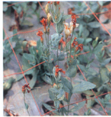
モザイク症状や奇形を生じる場合もある。