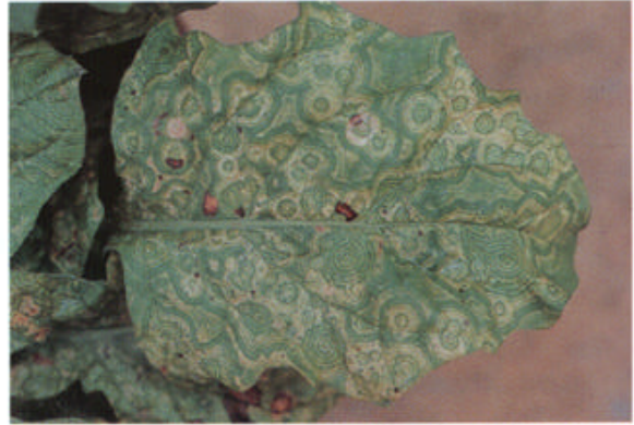
葉全面に形成された年輪状の輪紋