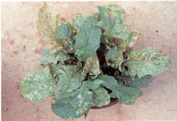
罹病株は株全体の葉に大小さまざまな輪紋を生じ、生育不良となる。