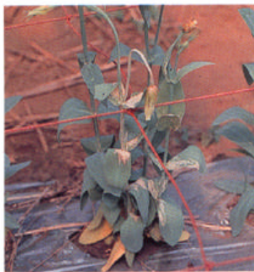
葉の一部が焼けたように退色し、後に全体が黄化・萎凋する。