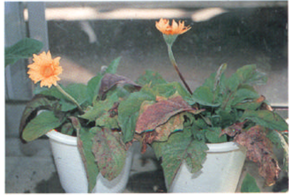
花柄は短く、屈曲する。花は小型化し、開花しても奇形となる。