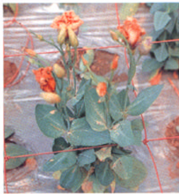
葉脈に沿って、小褐点を多数生じ、カスリ状を呈する。