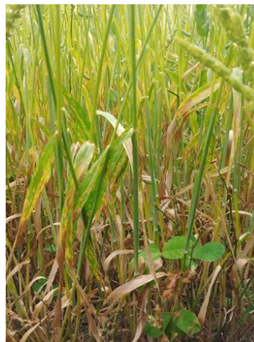
図 2 葉の病斑（出穂期以降）