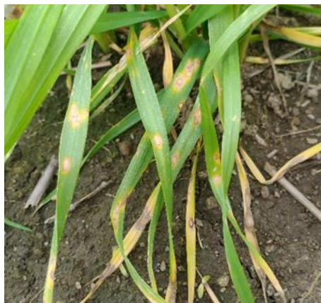
図 1 葉の病斑（2 月下旬）

(4) 第一次伝染源は、罹病残さに形成された子のう胞子で、二次伝染は病斑上に形成された分生子によって行われる。