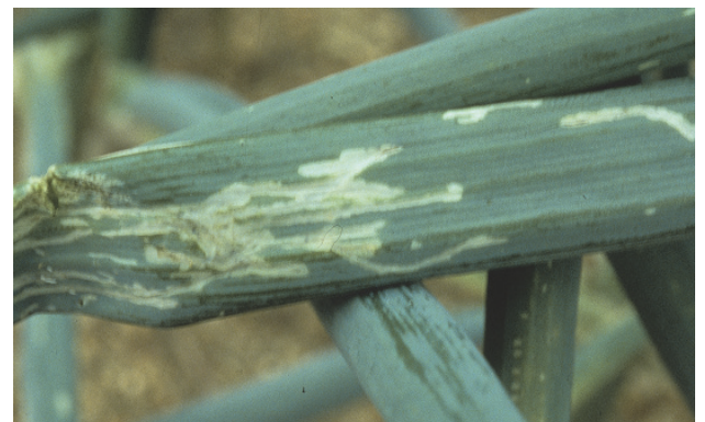
参考 A 系統の食害痕