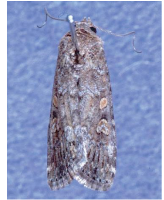
図4 シロイチモジヨトウ成虫