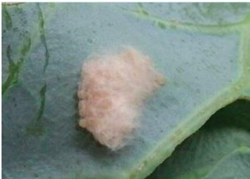
図2 シロイチモジヨトウ卵塊