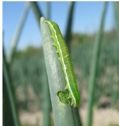
図3 ネギの葉を加害する シロイチモジヨトウ幼虫