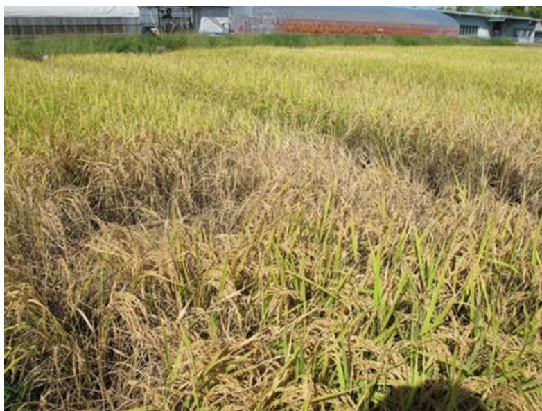
▲（参考）令和2年10月のトビイロウンカによる坪枯れ被害