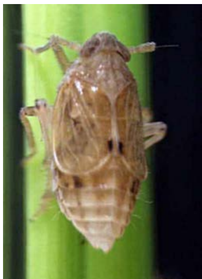
◀（参考）トビイロウンカ（短翅型・メス）