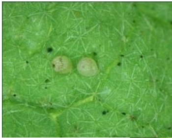
図 2: オオタバコガ卵

幼虫が蕾や果実、結球部に穴をあけて食入するのが特徴である（図 5）。大阪府内での作物への被害は、6～10 月まで続く。8～9 月の被害が最も多い。