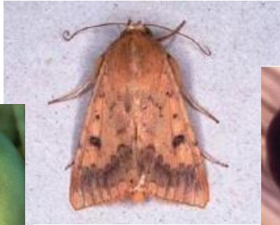
図 4: オオタバコガ雌成虫