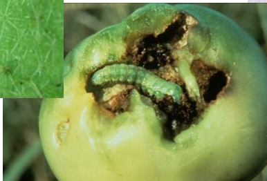
図 3: オオタバコガ幼虫