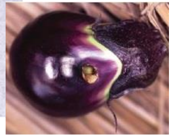
図 5: 水なすの食入痕