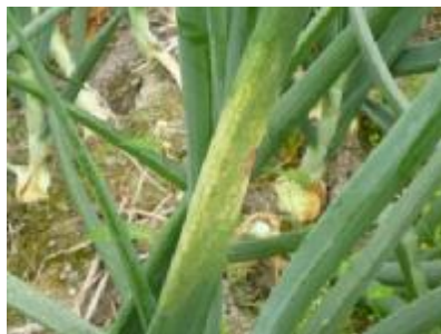
図2 2次感染株 (黄色で楕円形の病斑)