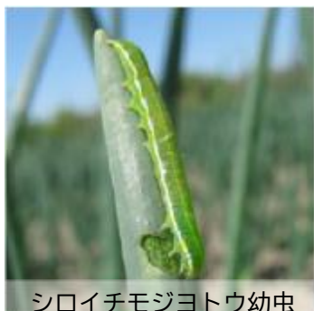
シロイチモジヨトウ幼虫