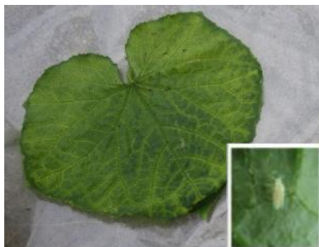
キュウリ退緑黄化病被害葉と コナジラミ成虫※