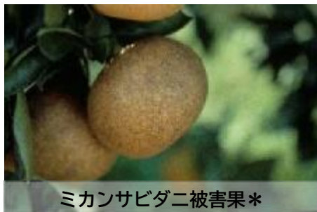
ミカンサビダニ被害果*