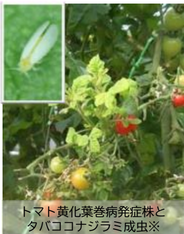
トマト黄化葉巻病発症株とタバココナジラミ成虫※