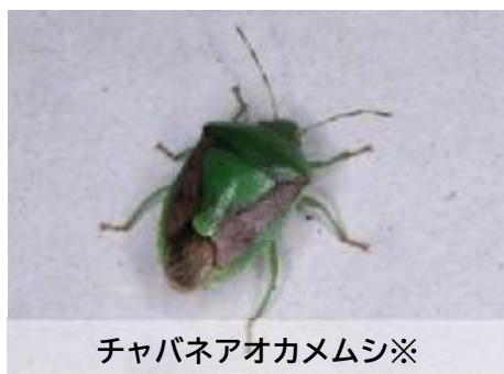
チャバネアオカメムシ※