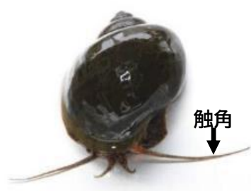
ジャンボタニシ (スクミリンゴガイ)