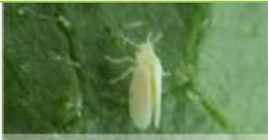
タバココナジラミ成虫※