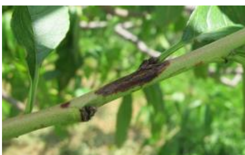
せん孔細菌病発病枝（夏型枝病斑）