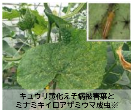
キュウリ黄化えそ病被害葉と ミナミキイロアザミウマ成虫※