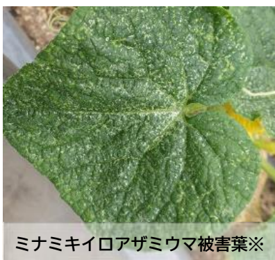
ミナミキイロアザミウマ被害葉※