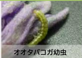
オオタバコガ幼虫