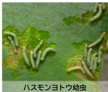
ハスモンヨトウ幼虫