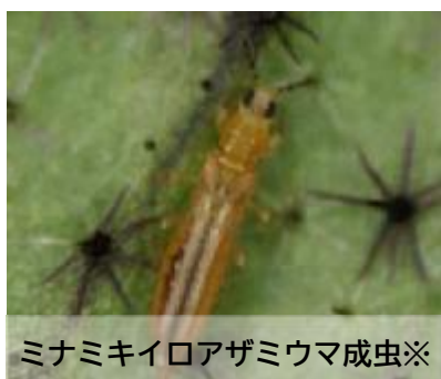
ミナミキイロアザミウマ成虫※