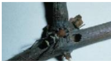
ブドウトラカミキリ*