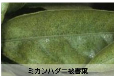
ミカンハダニ被害葉