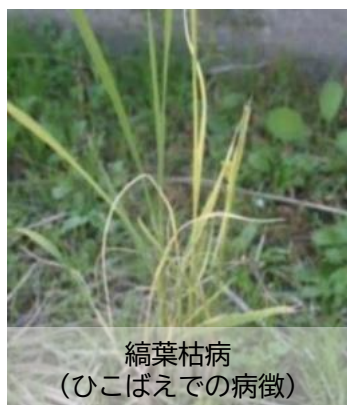
縞葉枯病 (ひこばえでの病徴)