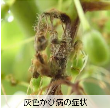
灰色かび病の症状