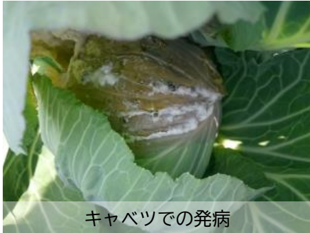
キャベツでの発病