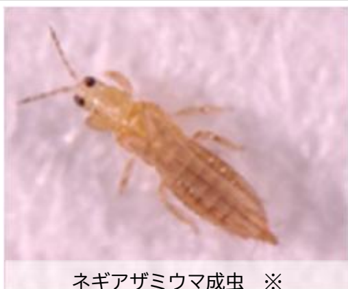
ネギアザミウマ成虫 ※