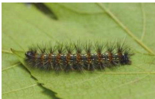
クワゴマダラヒトリの幼虫※