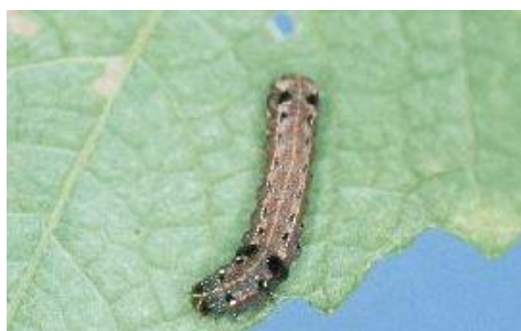
ハスモンヨトウの幼虫*