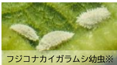
フジコナカイガラムシ幼虫※