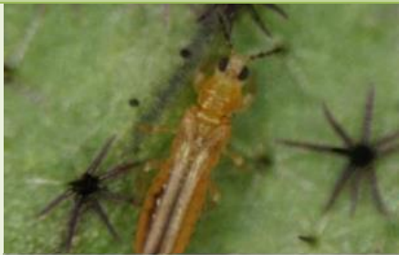
ミナミキイロアザミウマ成虫※