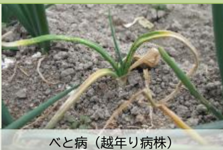
べと病（越年り病株）