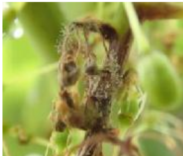
灰色かび病の症状