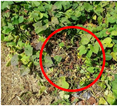
図 1 : 葉の変色