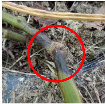
図 2 : 地際部の黒変