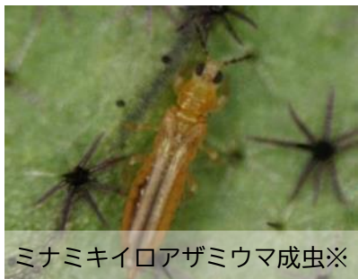
ミナミキイロアザミウマ成虫※