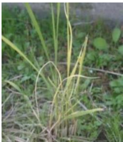
縞葉枯病(ひこばえでの病徴)