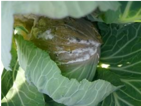
キャベツでの発生