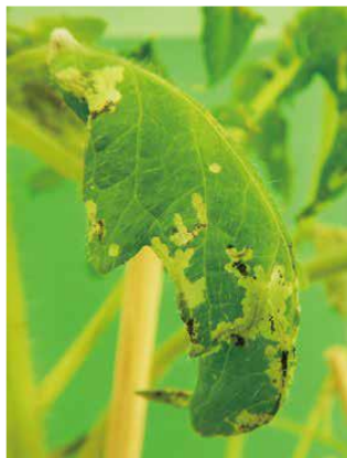
図3 トマト葉の被害