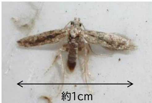
図1 府内で誘殺された成虫