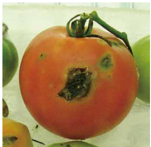
図4 トマト果実の被害