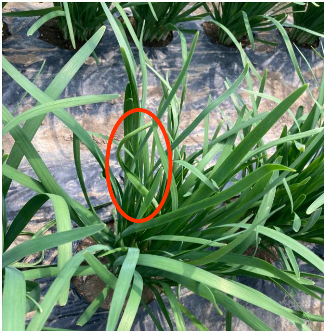
写真1 被害株 (葉の一部が湾曲)