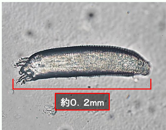
写真4 フシダニの成虫