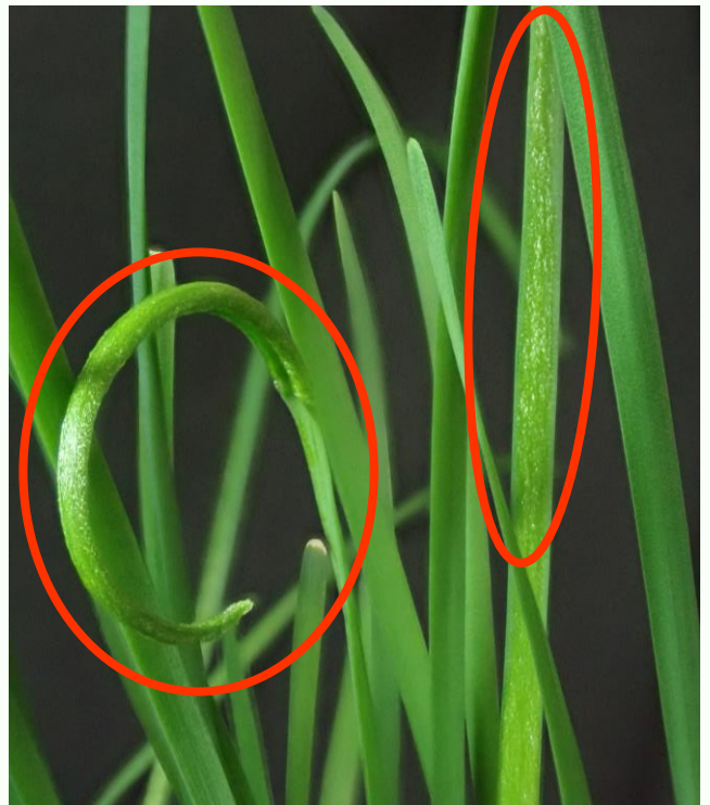
写真2 葉身の症状 (ビロード様に光る)